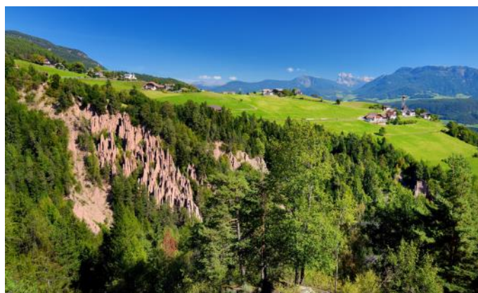
Der Ritten mit den Erdpyramiden