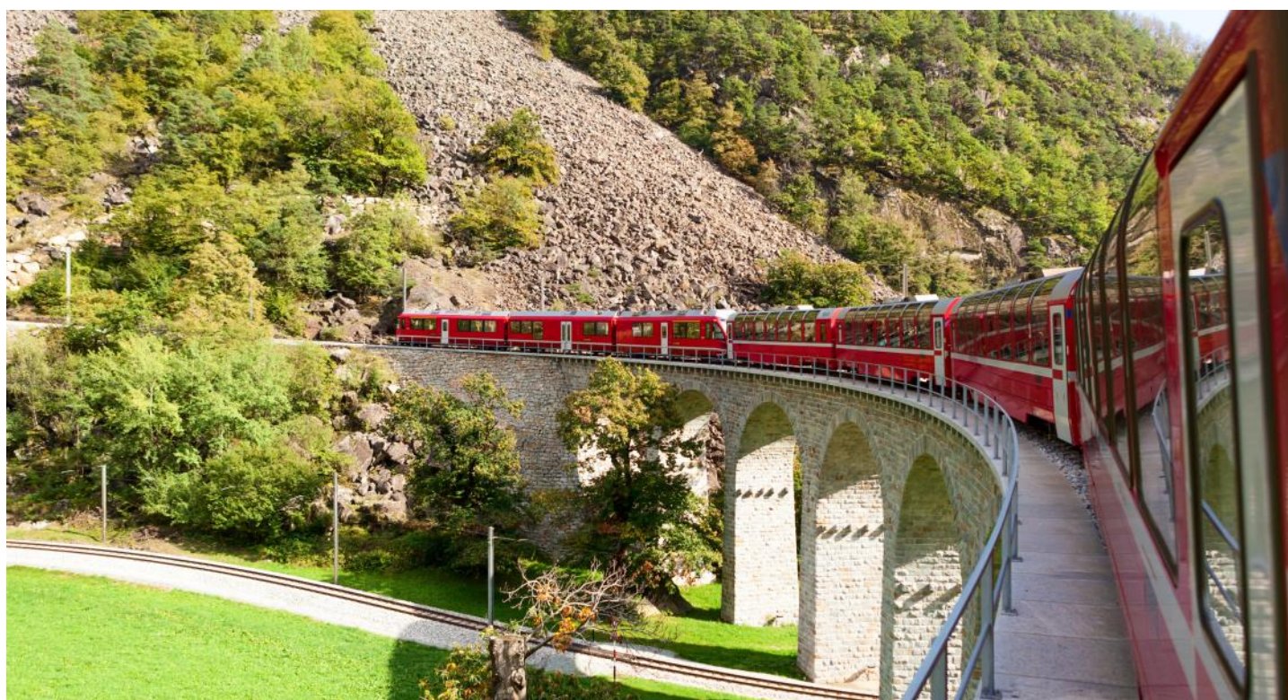
Immer wieder ein grossartiges Erlebnis: Die Fahrt mit der Berninabahn