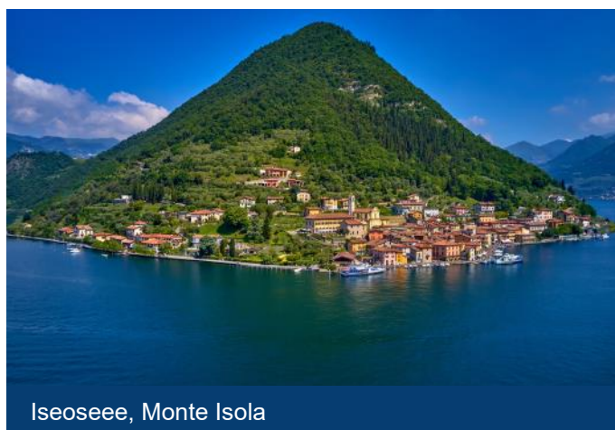
Iseosee, Monte Isola