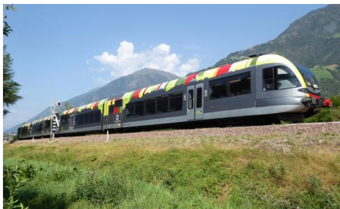
Moderne Vinschgerbahn (Foto *)