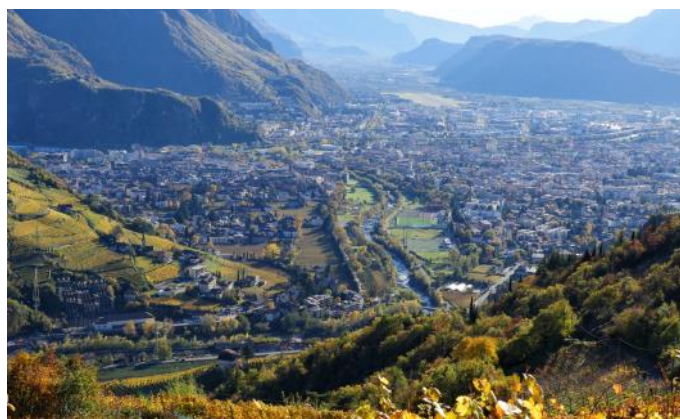
Blick auf Bozen