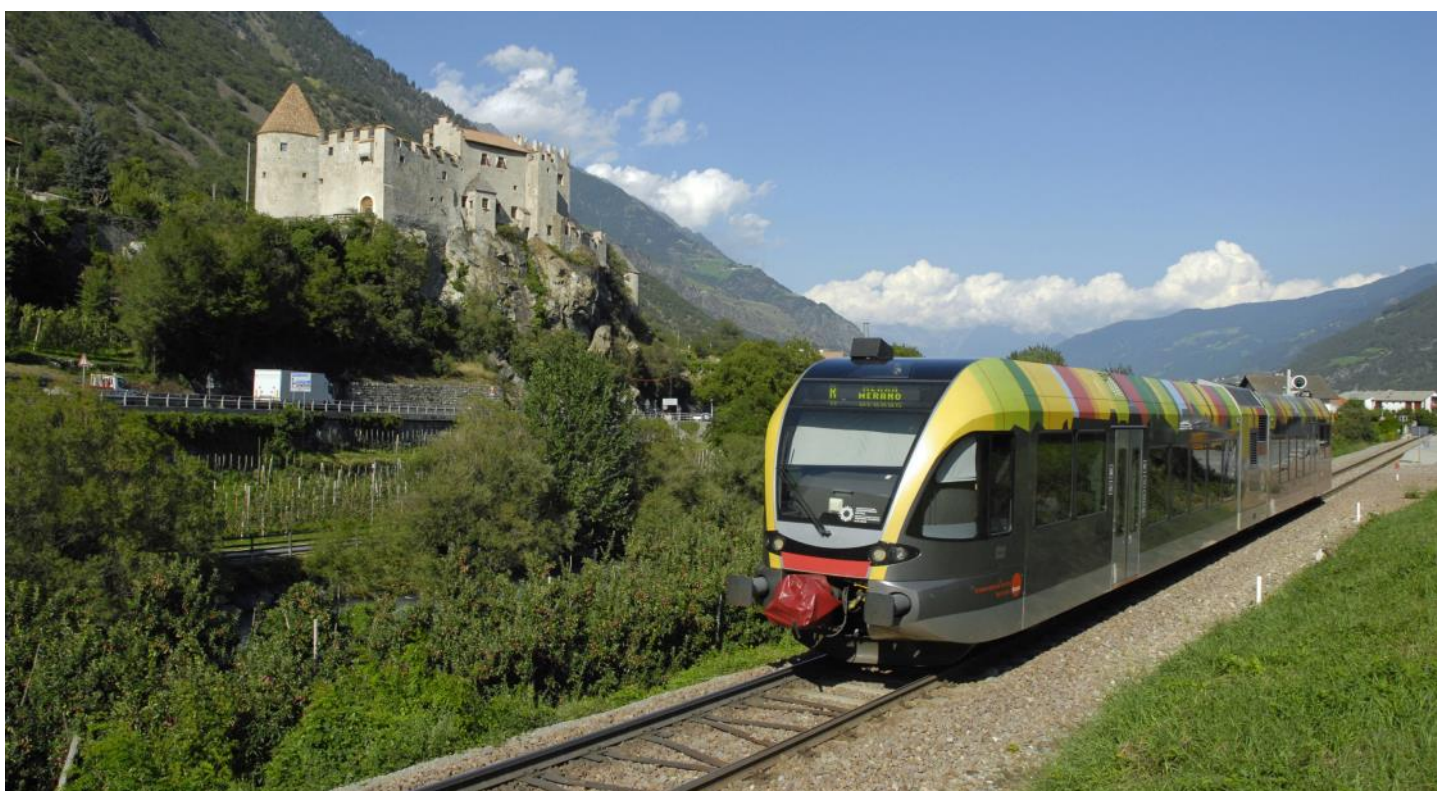
Fahrt mit der Vinschgerbahn durch den malerischen Vinschgau