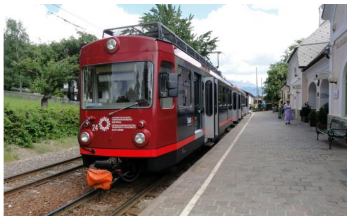
Rittnerbahn im Bahnhof Klobenstein (Foto *)

Die 60 Km lange, dieselbetriebene Normalspurstrecke von Meran nach Mals wurde 1906 eröffnet. Geplant war, die Strecke über den Reschenpass nach Landeck im Inntal weiterzubauen. Im Rahmen der Abtretung des Südtirols an Italien gelangte die Strecke nach dem ersten Weltkrieg zur Staatsbahn FS, die sie im Jahre 1990 einstellte. Die Provinz Südtirol übernahm die Strecke und modernisierte den Betrieb. Heute verkehren moderne GTW Triebwagenzüge in einem dichten Takt und ein Teil der Züge verkehrt durchgehend bis nach Bozen. Das attraktive Angebot wurde von der Bevölkerung und den Touristen sehr gut angenommen und so sind weitere Verbesserungen und die Elektrifizierung geplant.