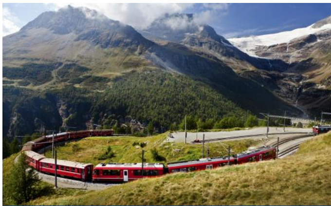
Berninabahn in Alp Grüm

Die 105 Km lange, dieselbetriebene Normalspurstrecke von Brescia über Iseo nach Edolo wurde zwischen 1885 und 1909 in Betrieb genommen. Ursprünglich von der Privatbahn SNFT betrieben, wird der Zugverkehr heute von der Bahngesellschaft Trenord betrieben. Trenord ist ein Gemeinschaftsunternehmen zwischen der Staatsbahn FS und der Ferrovia Nord Milano und betreibt heute den gesamten, regionalen Zugverkehr in der Region Lombardei. Auf der Strecke gibt es einen dichten Taktverkehr. Eine Besonderheit auf dieser Strecke ist der «Treno dei Saponi». Dieser Touristenzug besteht aus einer Diesellokomotive und älteren Personenwagen, die als Speisewagen eingerichtet wurden. Während der Fahrt wird ein gastronomisches Menu serviert.