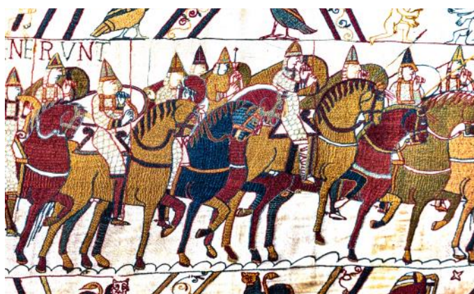
Tapiserie in Bayeux