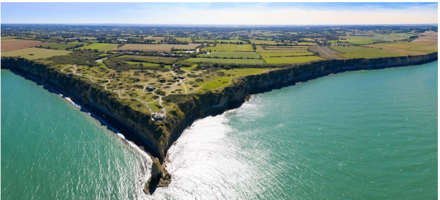
La Point du Hoc