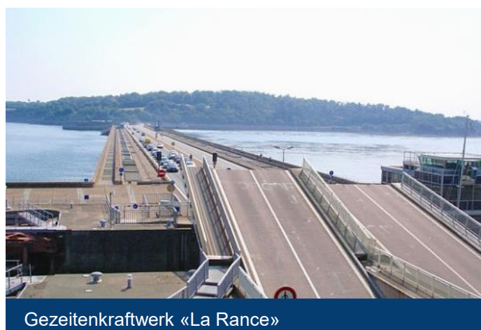
Gezeitenkraftwerk «La Rance»

Programmänderungen bleiben ausdrücklich vorbehalten!