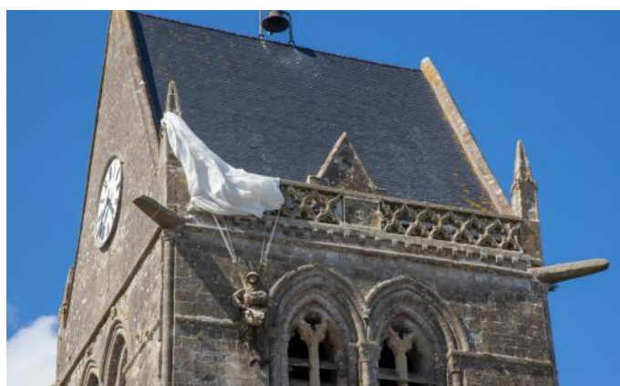
Kirchturm in Sainte - Mère - Église