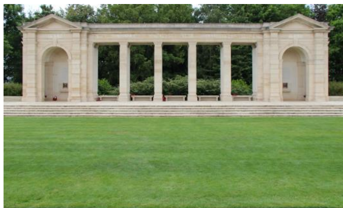
Britischer Militärfriedhof in Bayeux