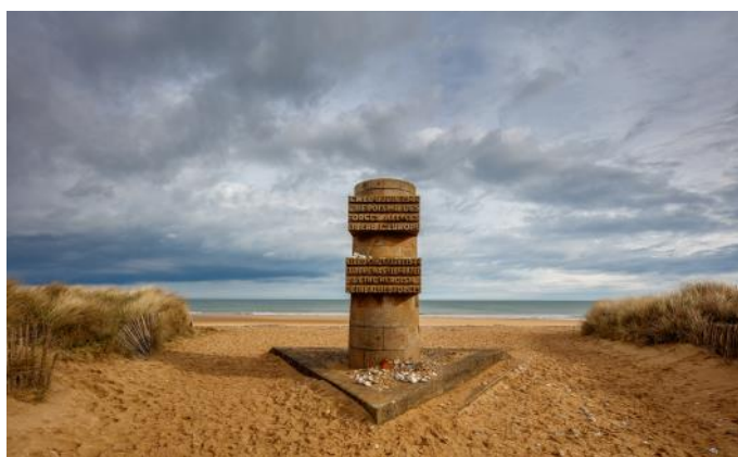
Juno Beach, D-Day Denkmal