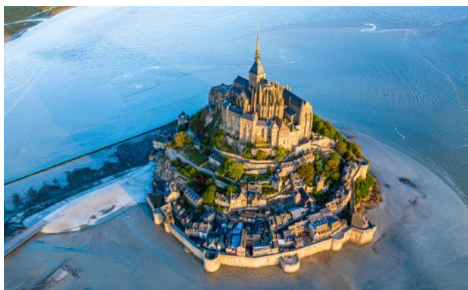
UNESCO Welterbe: Le Mont-Saint-Michel