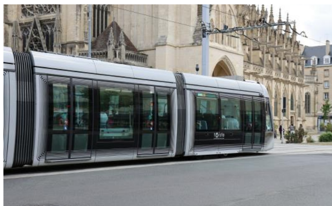
«Twisto» Tram in Caen