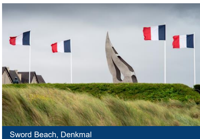
Sword Beach, Denkmal

Schweizer Bürger und Bürger der EU benötigen für diese Reise eine gültige Identitätskarte oder einen gültigen Reisepass.