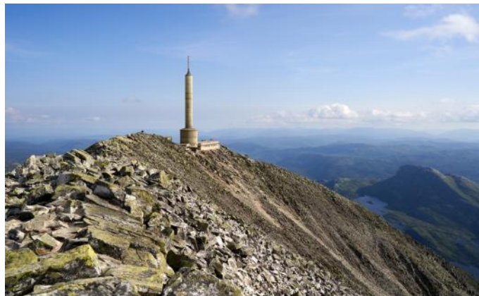
Prächtige Aussicht vom Gaustatoppen

Schweizer Bürger und Bürger der EU benötigen für diese Reise eine gültige Identitätskarte oder einen gültigen Reisepass.