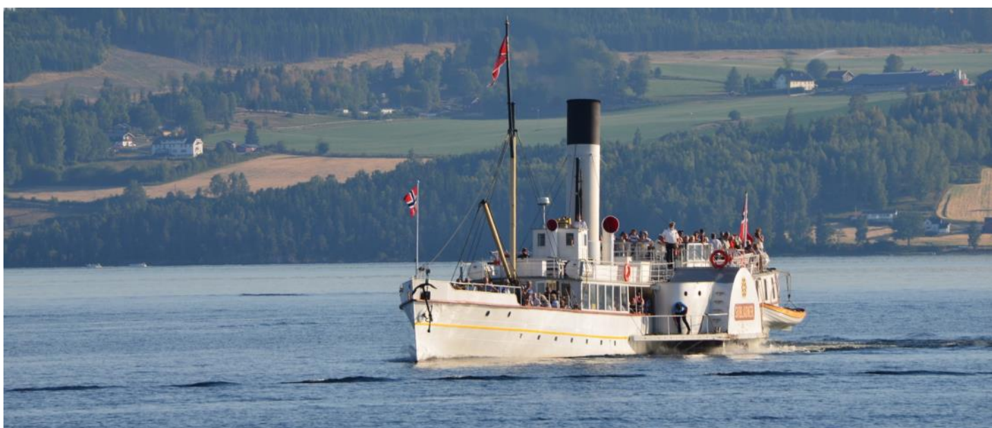
Dampfschiff Skibladner auf dem Mjøsasee.