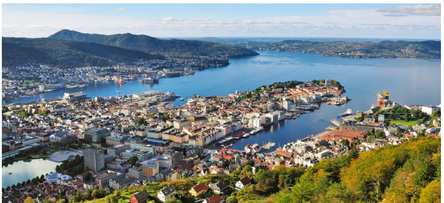
Blick auf die Hansestadt Bergen