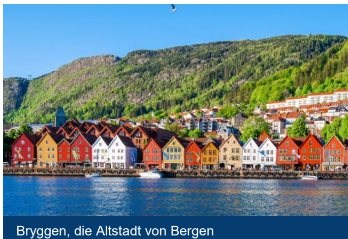
Bryggen, die Altstadt von Bergen

Abendessen und Übernachtung in Bergen. (2 Nächte)