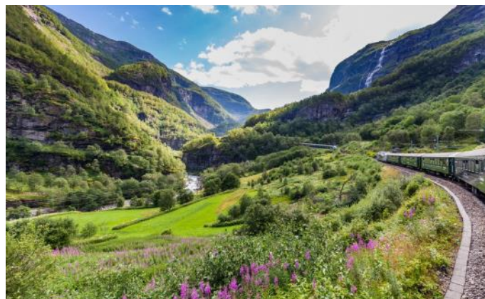
Flåmbahn zwischen Flåm und Myrdal

Abendessen und Übernachtung in Oslo. (3 Nächte)