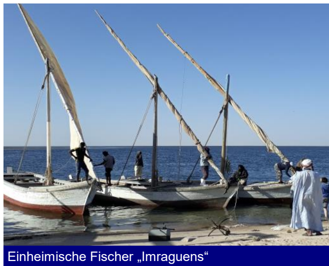
Einheimische Fischer „Imraguens“