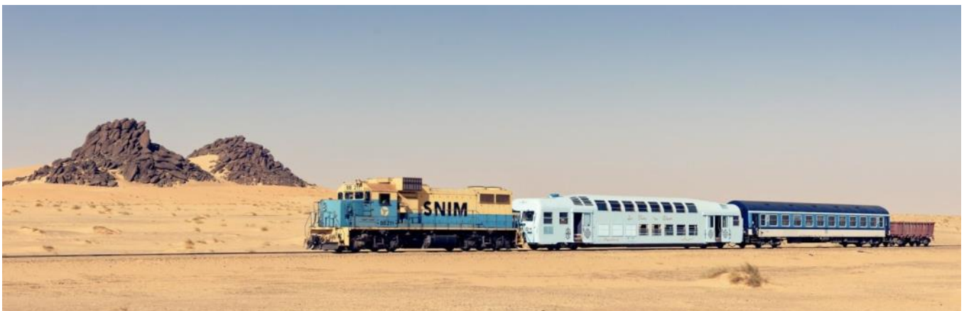
Mit dem Wüstenzug von Choum nach Zourérate