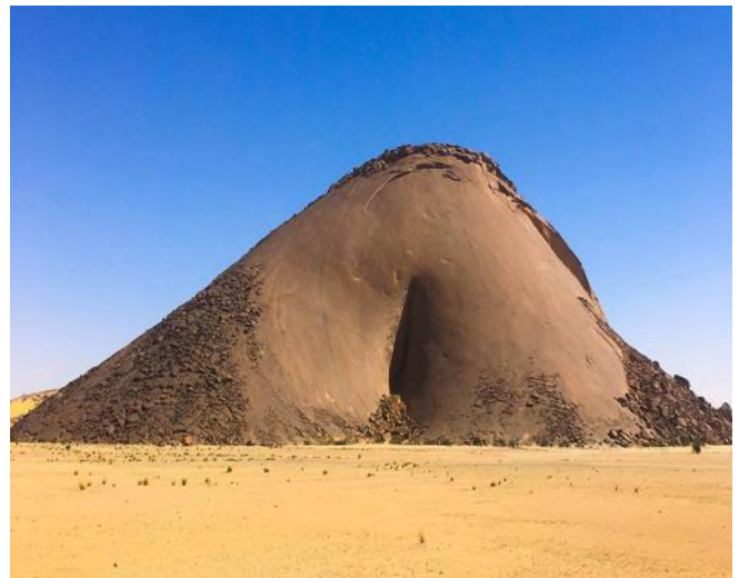
Monolith bei Ben Amira

Der «Ben Amira» ist der drittgrösste Monolith der Welt. Grösser sind nur noch der «Ayers Rock» und der «Mount Augustus». Unser traditionelles Sahara-Camp (mauretaniische Zelte) liegt am Fusse dieses imposanten Monoliths. In Aïcha besichtigen wir die Wandmalereien sowie das Bildhauersymposium, welches durch die grössten Bildhauer der Welt gestaltet wurde. Übernachten im Camp