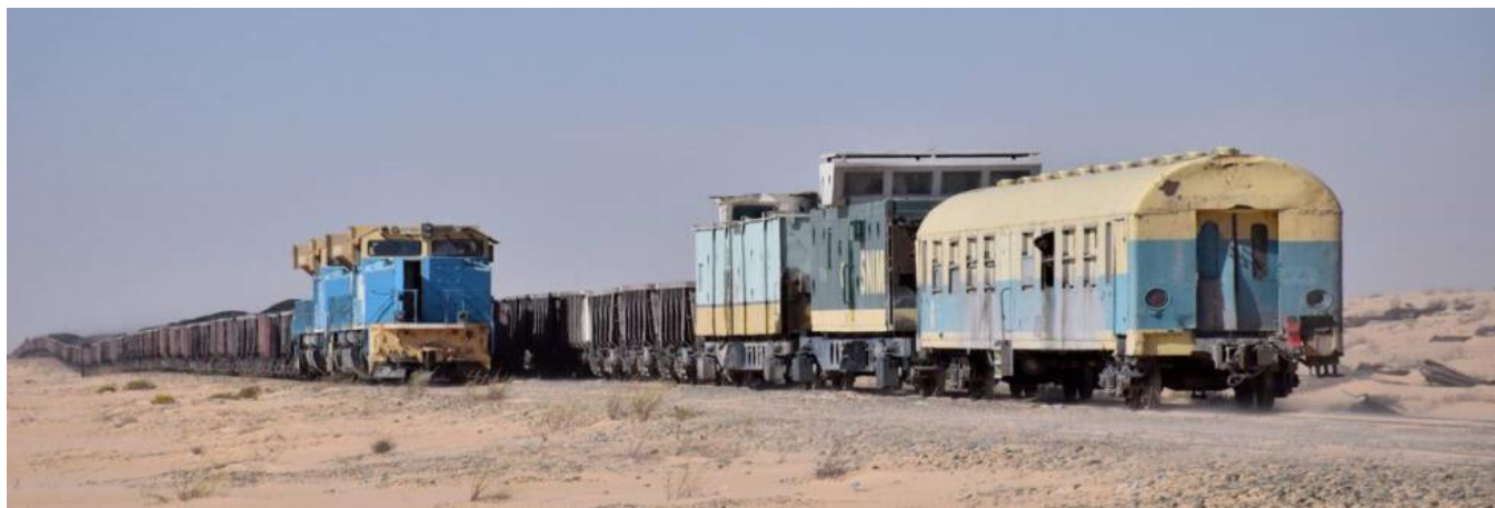
Eisenerz - Züge auf der Strecke zwischen Zouérate und Nouadhibou

Im SERVRAIL- Programm werden der Eisenerz-, Service- und Wüstenzug benützt.