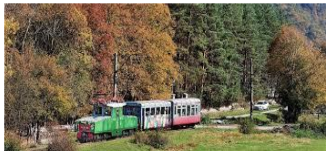
Extrazug Kukushka - Borjomi

Fahrt durch „Swanetien - die Krone des Kaukasus“ bis Mestia . Rundgang durch den Ort, anschliessend Fahrt mit der Seilbahn auf den Hatsvali Berg, von wo man das Gebirgs Panorama bestaunen kann. Unterkunft für zwei Nächte.