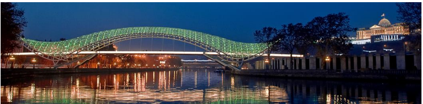
Tiflis - Brücke des Friedens

Schweizer und EU-Bürger benötigen für die Einreise einen gültigen Reisepass, der noch 6 Monate über das Reisedatum gültig ist. Stand April 2023!