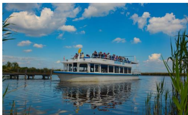
Schiffahrt auf dem Neusiedlersee