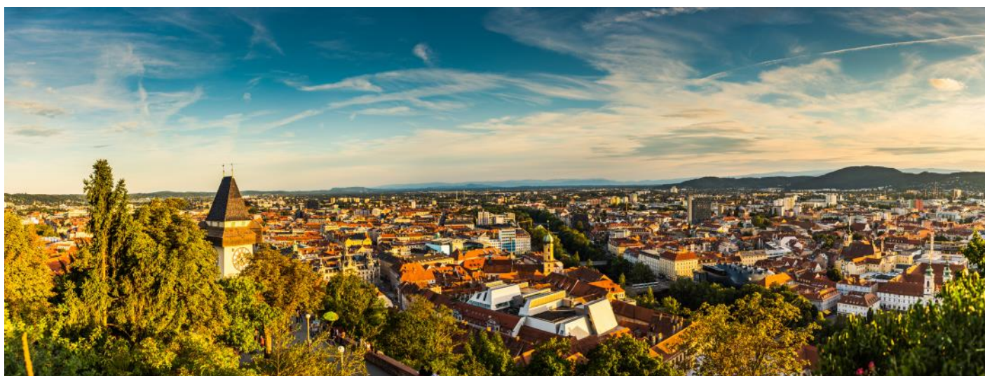
Panorama von Graz