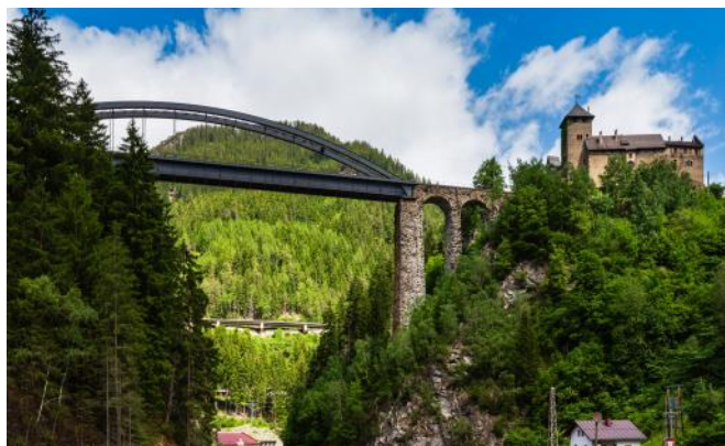
Trisannabrücke mit Schloss Wiesberg

Nach dem Frühstück Fahrt nach Rein wo wir das Zisterzienserstift besichtigen. Nach einem Mittagessen fahren wir zurück nach Graz. Nachmittag zur freien Verfügung. Die