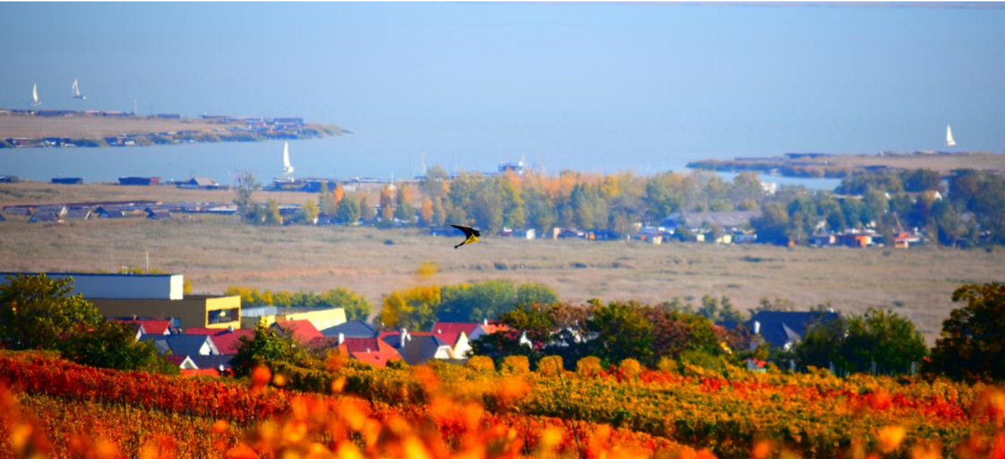
Weinberg mit Neusiedlersee