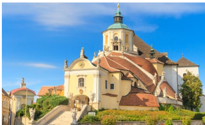
Haydn Kirche in Eisenstadt