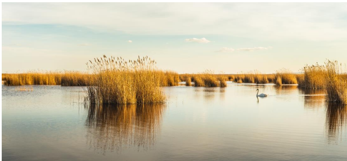
Schilfgürtel am Neusiedlersee