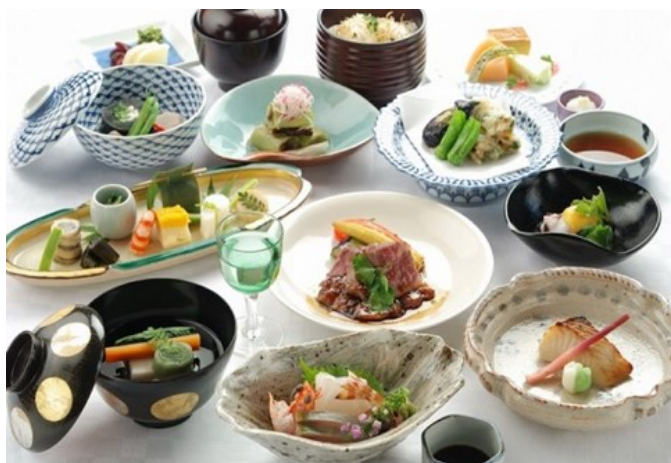
Japanese Dinner - en guete!

Bahnfahrt von Takasaki nach Kurobe. Von dort fahren wir mit einer Schmalspurbahn in die schöne Kurobe Schlucht. Mittagessen in einem lokalen Restaurant. Kurze Wanderung. Traditionelles Nachtessen und Übernachtung in einem Hotel im japanischen Stil (Ryokan) in Unazuki. Unterkunft für eine Nacht