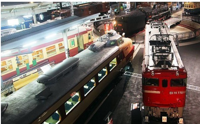
Eisenbahnmuseum in Saitama

Besuch des interessanten Eisenbahnmuseum. Am Nachmittag Fahrt mit dem Shinkansen nach Takasaki. Mittagessen unterwegs in einem lokalen Restaurant.