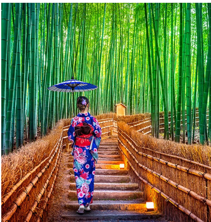
Die weltberühmten Bambus - Haine