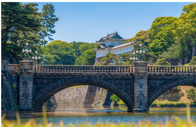
Kaiser Palast in Kyoto

https://www.kintetsu.co.jp/senden/aoniyoshi/