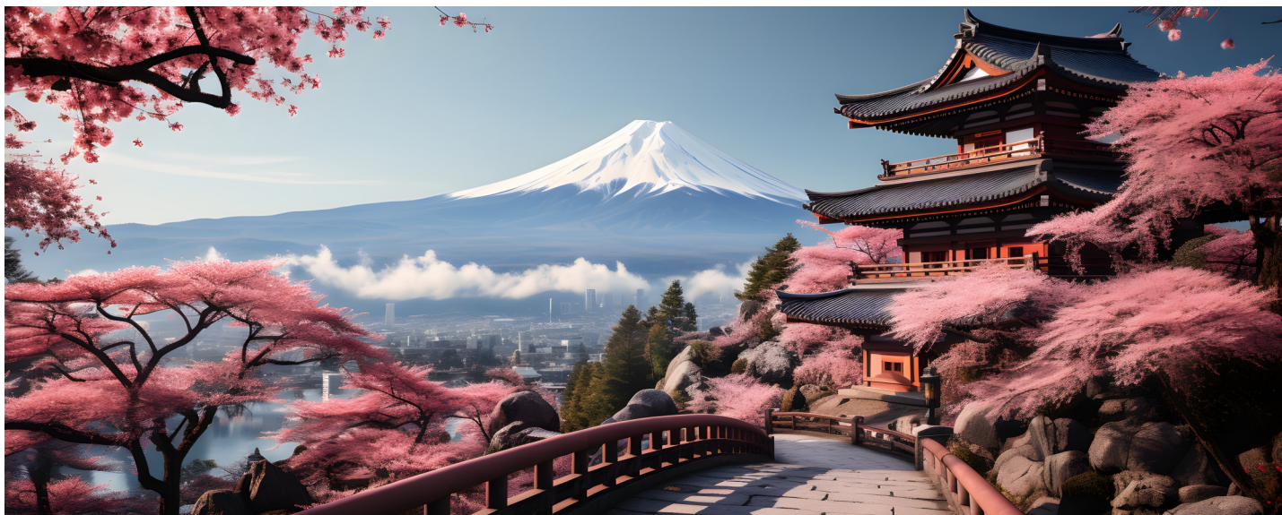
Eine tolle Sicht auf den höchsten Berg in Japan - Fujiama 3'776m hoch!