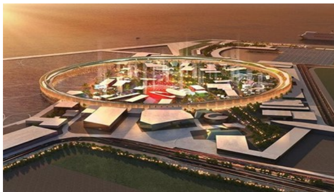
Vision von WORLD EXPO Osaka

Fahrt zur Osaka Expo mit Zug und Shuttle-Bus. Und zurück. Besichtigung der Weltausstellung.