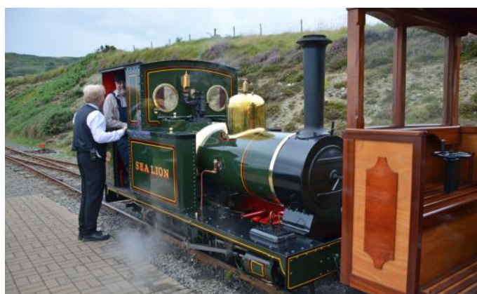
Groudle Glen Railway