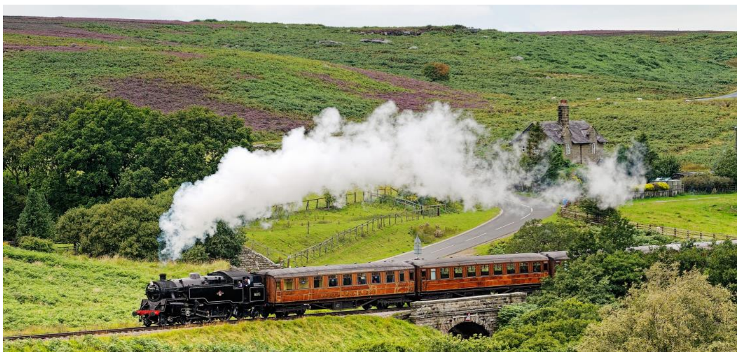
Dampfzug der «North Yorkshire Moors Railway»