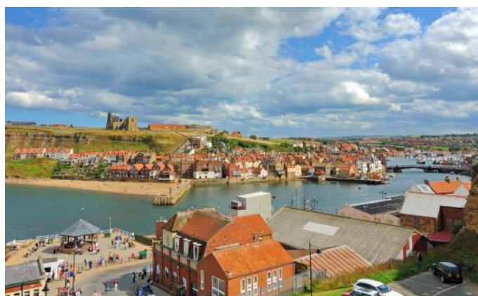
Whitby mit der Whitby Abbey