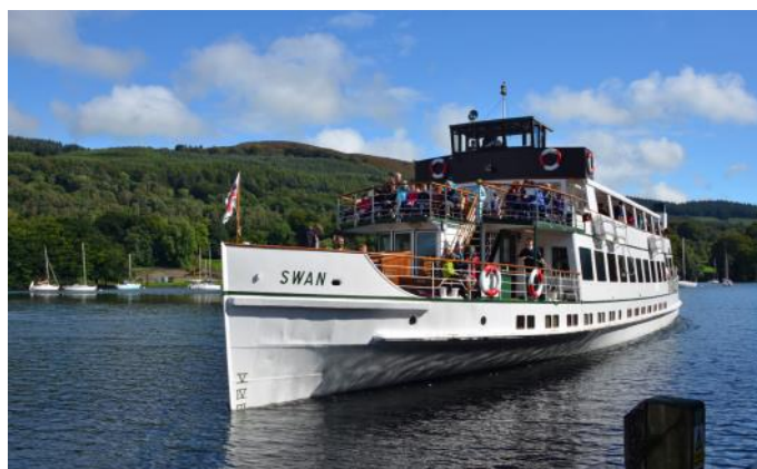
Schifffahrt auf dem Lake Windermere