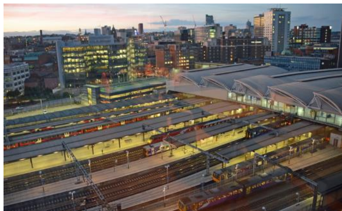
Abendlicher Bahnhof Leeds