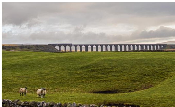
Der Ribbleshead-Viadukt (Settle & Carlisle Linie)

Die normalspurige Strecke führt von Barrow-in-Furness nordwärts und entlang der Westküste nach Carlisle. Der Zugverkehr erfolgt mit Dieseltriebwagen der Bahngesellschaft «Northern». Aufgrund der malerischen Streckenführung direkt entlang der Meeresküste wird auch diese Strecke oft von touristischen Dampfzügen befahren.