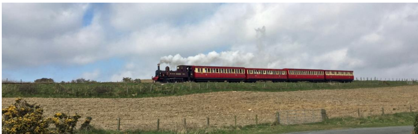
Dampfzug der «Isle of Man Railway» bei Port Soderick

Die Pferde-Strassenbahn «Douglas Bay Horse Tramway» verbindet den Schiffsanleger Victoria Pier mit der Endhaltestelle Derby Castle, wo sich die Abfahrtsstelle der Manx Electric Railway befindet. Die rund 2,8 Km lange Tramstrecke wurde 1876 in Betrieb genommen und weist eine Spurweite von 914 mm auf.