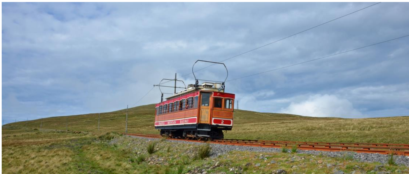
Die «Snæfjell Mountain Railway»