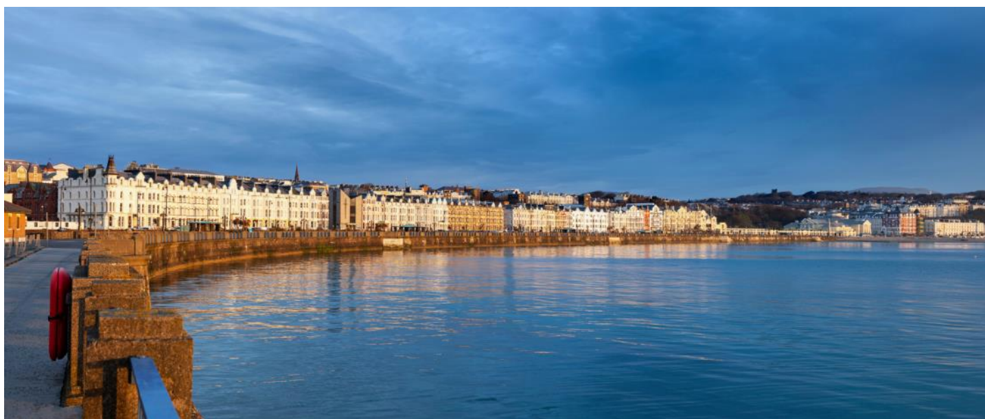
Blick auf die Promenade von Douglas

Während des Aufenthalts auf der Insel Man verfügen Sie über einen persönlichen, im Reisepreis inbegriffenen Transportpass. Mit diesem können beliebige Fahrten mit den Bahnen und Bussen auf der Insel Man unternehmen. Sie können auch individuelle Fahrten nach eigenen Ideen unternehmen.