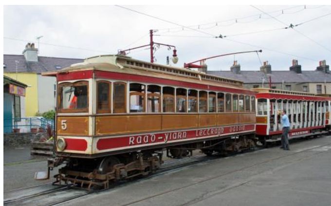
Manx Electric Railway in Ramsey

Heute reisen wir über zwei landschaftlich besonders schöne Bahnstrecken. Carfahrt nach Barrow in Furness. Hier besteigen wir den Regionalzug mit dem wir entlang der malerischen Küste und über Whitehaven nordwärts