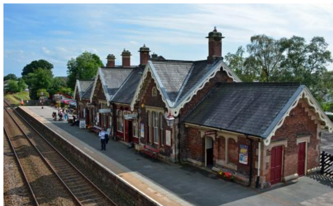
Bahnhof Appleby (Settle & Carlisle Line)

York zählt zweifelsohne zu den attraktivsten Städten Englands. Die Geschichte reicht bis in die Römerzeit zurück. Innerhalb der noch erhaltenen Stadtmauer wird das malerische Stadtzentrum von den Türmen des grössten Münsters in Europa und 18 weiteren, mittelalterlichen Kirchen, überragt. Wir fahren mit dem Zug nach York und besichtigen am Vormittag die historische