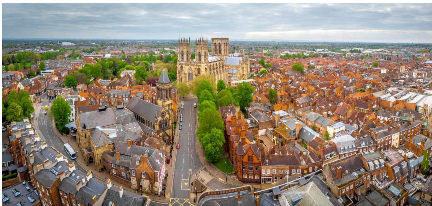
Blick auf die Stadt und das Münster von York