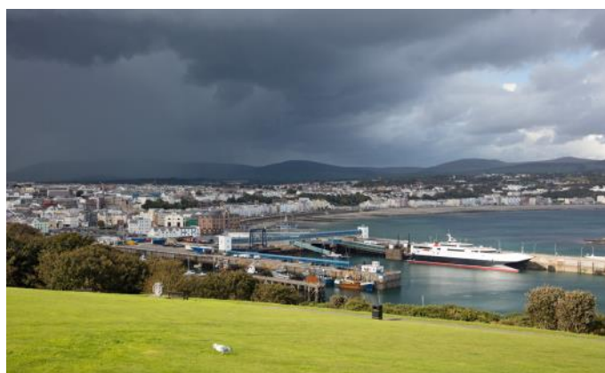
Der Hafen von Douglas