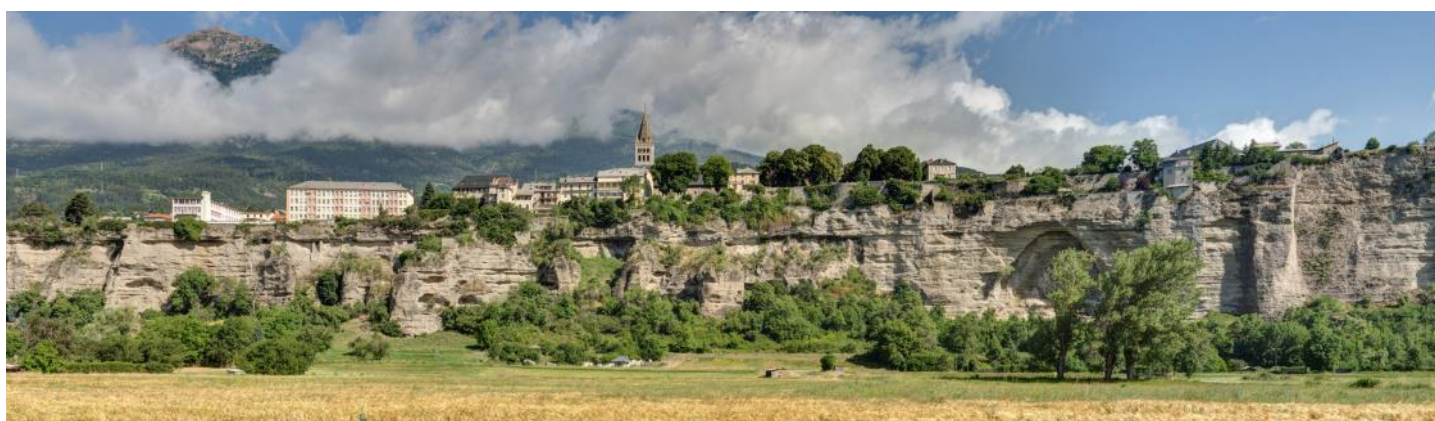
Die auf einem Felsen gelegene Stadt Embrun