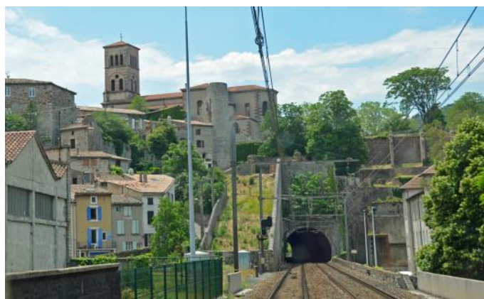
Unterwegs auf der Strecke rechts der Rhone

Die alte Magistrale Paris - Lyon - Valence - Marseille liegt auf der linken Seite der Rhone. Es gibt aber auch auf der rechten Seite der Rhone eine Bahnstrecke. Diese beginnt im südlich von Lyon gelegenen Bahnhof Givors-Canal und führt entlang der Rhone über Tournon - La Voulte-sur-Rhône - Villeneuve-lès-Avignon nach Nîmes. Diese Strecke ist doppelspurig und elektrifiziert, wird jedoch ausschliesslich von Güterzügen und gelegentlichen Reiseextrazügen benützt. Zudem dient sie auch als Ausweichstrecke, bei Störungen. Zwischen den beiden Linien gibt es Verbindungsstrecken, die die Rhone überqueren. Dies zwischen Peyraud und St-Rambert-d'Albon, zwischen La Voulte und Livron und im Raum Avignon. Anlässlich unserer Reise benützen wir teilweise die Strecke rechts der Rhone und überqueren so auch die Rhone mit den Verbindungsstrecken. Das ist ein Erlebnis, das Passagieren in Reiseextrazügen vorbehalten ist!