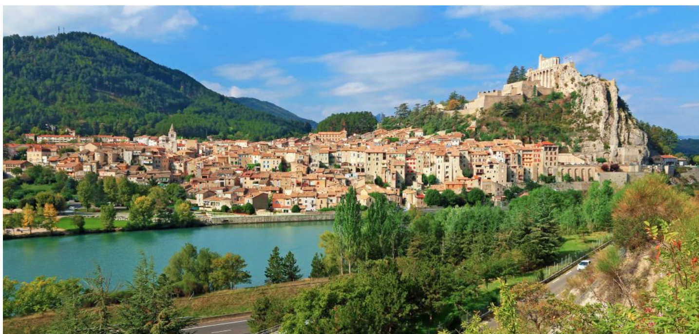
Blick auf die Altstadt und die Zitadelle der an der Durance gelegenen Stadt Sisteron