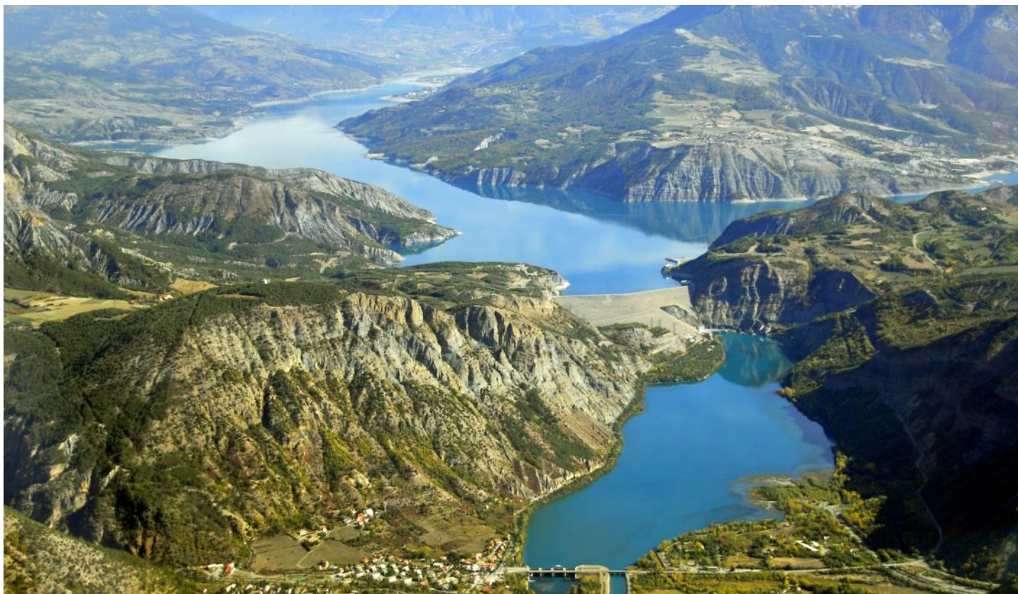
Die zum «Lac de Serre-Ponçon» gestaute Durance