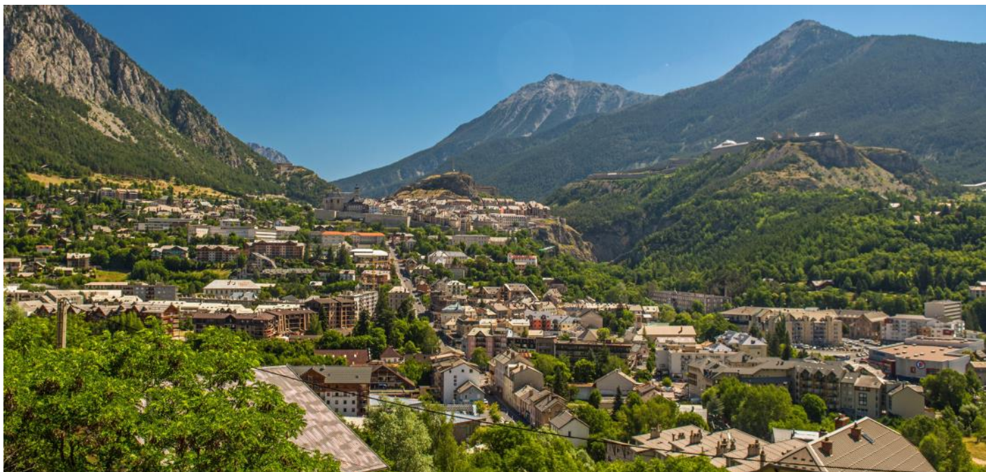
Festungsstadt Briançon mit Oberstadt und Festungsanlagen

auf den Zusammenfluss von Durance und Guil. Sie ist eine der neun Festungen, die Vauban im Auftrag König Ludwigs XIV, zur Abwehr der savoyischen Truppen, entlang der Alpengrenze, errichtete. Danach fahren wir über Guillestre und über den Pass von Vars (2'111 m) hinüber ins wildromantische Tal des Flusses Ubaye. Am Nachmittag treffen wir in Barcelonnette ein. Das Städtchen mit mediterranem Flair liegt im Tal der Ubaye und am Rande des Nationalparks «Mercantour». Nach einem Aufenthalt zur individuellen Besichtigung fahren wir durch das Tal der Ubaye und entlang des Stausees «Serre-Ponçon» zurück nach Gap. Unterwegs sehen wir uns die Erdsäulen «Demoiselles coiffées» (Frisierte Fräuleins) an.