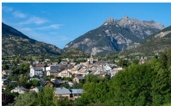
Blick auf Guillestre