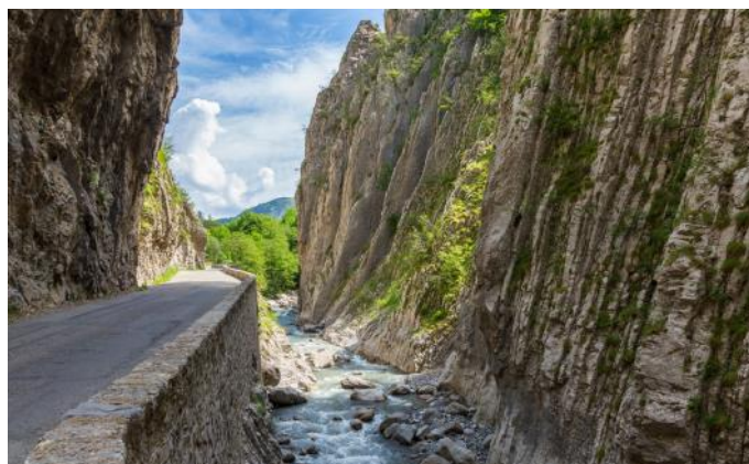
Die «Cluses de Barles»